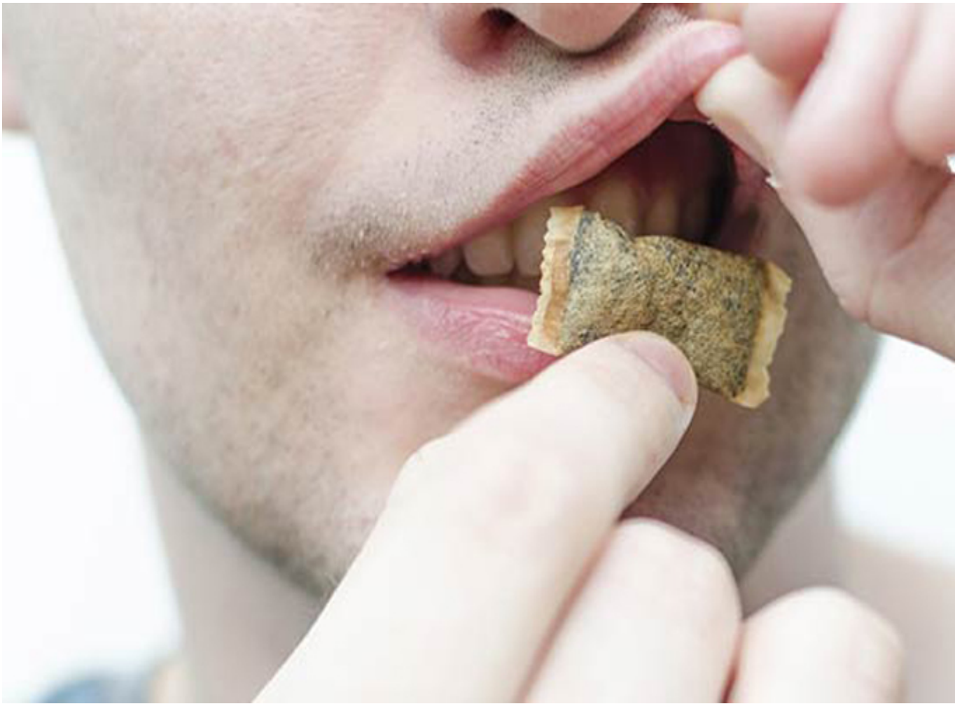
Способ употребления снюса