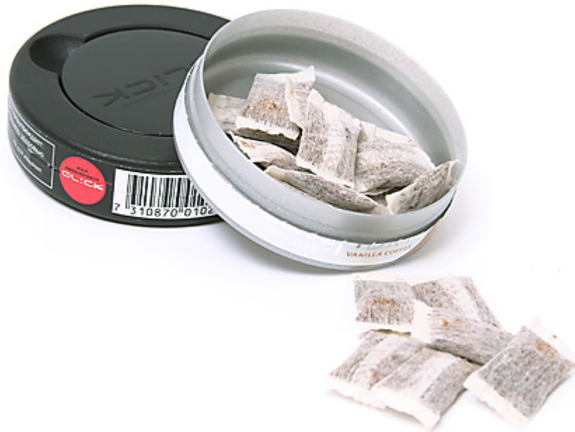
Так выглядит снюс