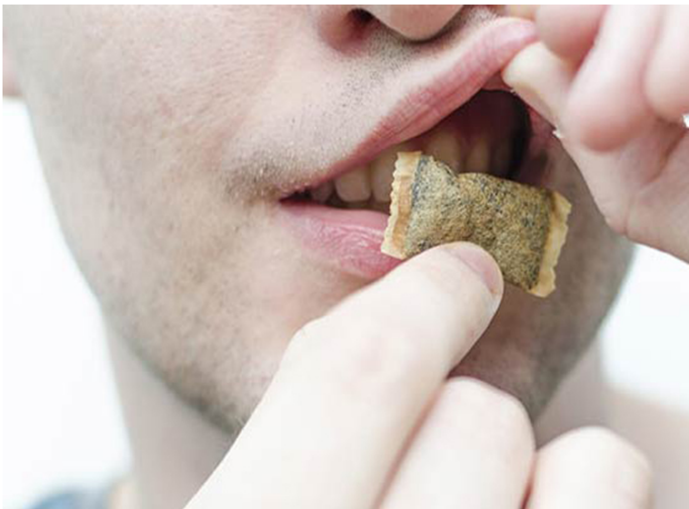
Способ употребления снюса

очередную дозу никотина там, где курить нельзя — на дискотеках, мероприятиях, в ресторанах и самолетах.