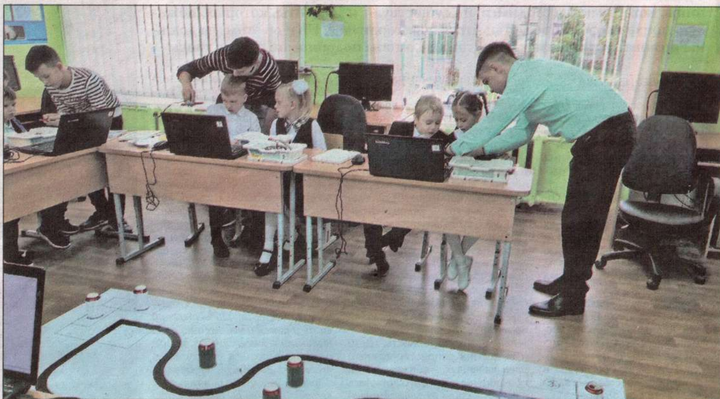
Мастер-класс по робототехнике для будущих первоклассников проводился в школе № 15 в августе прошлого года с привлечением волонтеров – школьников, посещающих кружок робототехники.

Инновационные и инженерные технологии в современном обществе становятся неотъемлемой частью образовательной деятельности. В связи с актуальностью их развития, компьютеризацией производства освоение основ конструкторской и проектно-исследовательской деятельности учащимися заложено в федеральных государственных образовательных стандартах. Изучение информатики и робототехники в школе становится все более значимым и актуальным, так как способствует развитию личности ребенка и его социализации в обществе. Большая роль в этом процессе отводится учителю, организующему учебный процесс.