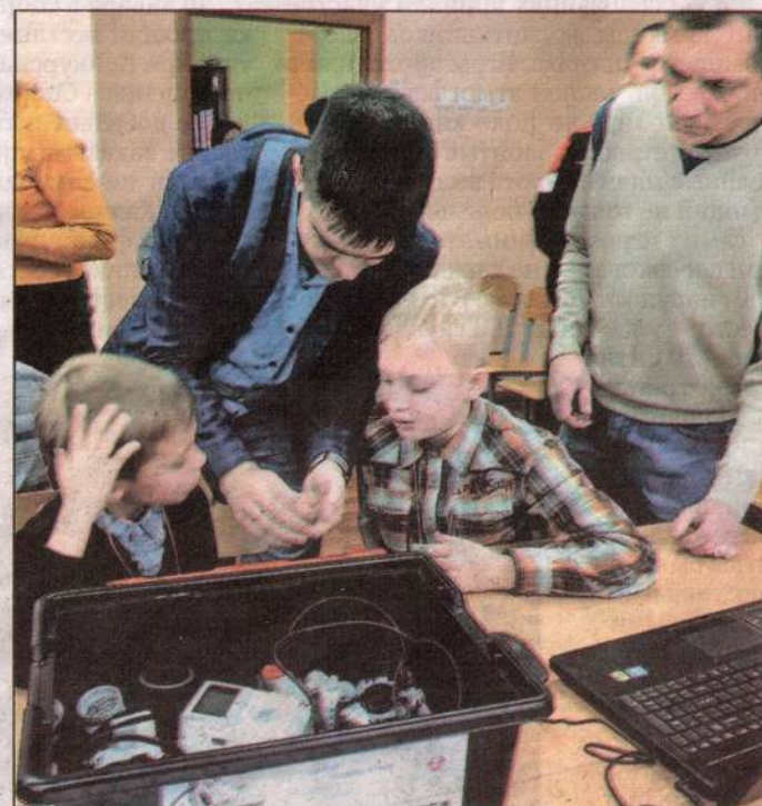
Подготовка к участию в окружных соревнованиях по робототехнике в Новой Ляле, 2019 год.